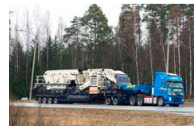
Einfacher Transport dank kompakter Abmessungen.