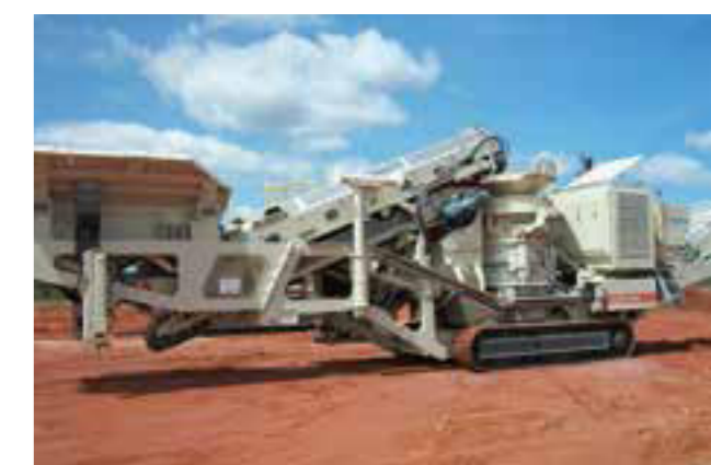
Der Lokotrack LT300HP ist mit Bandaufgeber ausgerüstet oder alternativ mit einem Vibrationsaufgeber mit Rost.